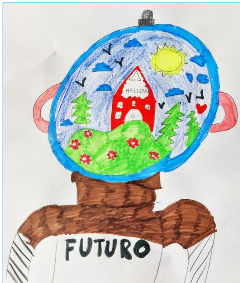
Disegno: Telemaco di Anita Cavigioli, Mentore, Milano