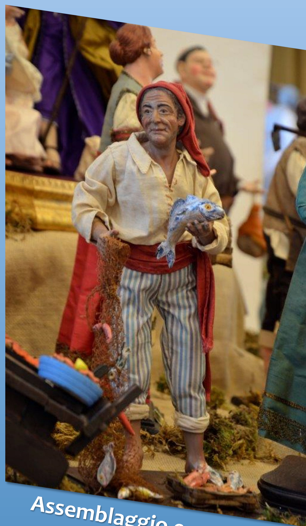
Assemblaggio e vestitura pastori del '700